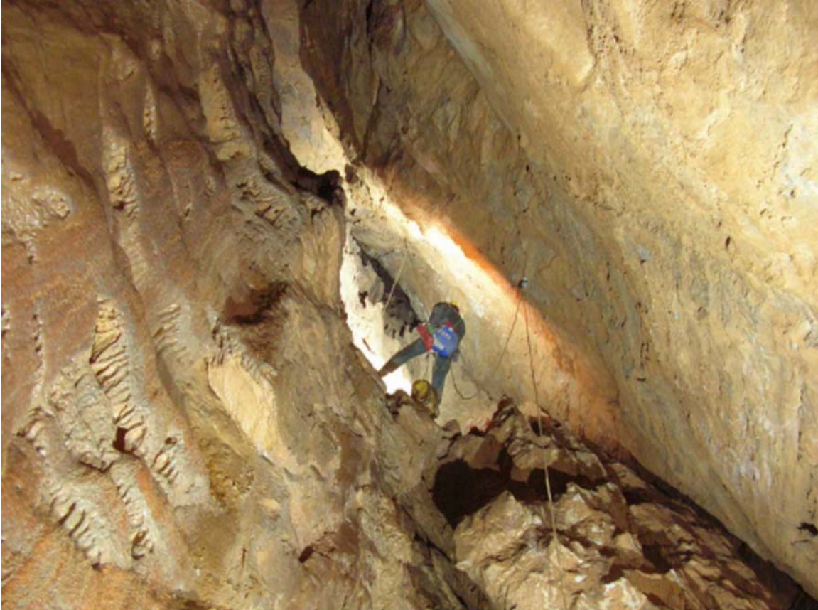
Abisso Demetrios Stratos, sala Jam Session

In allegato due fotografie scattate all'interno di cavità esplorate negli ultimi anni dal Gruppo Nottole sotto il monte Arera: